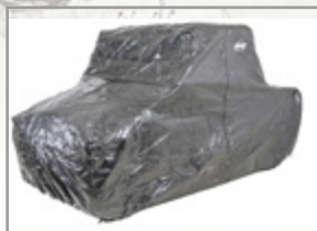
HOUSSE DE PROTECTION KYMCO POLYESTER IMPERMÉABLE HOUSSE SSV 2800 x 1790 x 1450mm : KA-01-0467 HOUSSE QUAD 2600 x 1400 x 1350mm : KA-01-0466