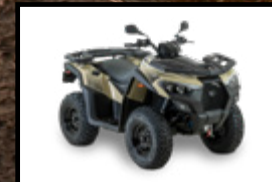
SABLE / NOIR