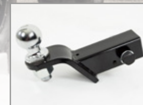
KIT ATTELAGE UXV 450i / 700i : KA-01-0215