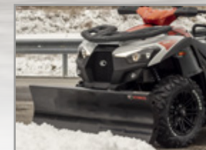
LAME À NEIGE ET AGRICOLE 1400 MM + SUPPORT MXU 500/550/700 KA-01-0380