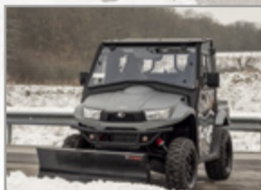
LAME À NEIGE ET AGRICOLE 1700 MM + SUPPORT UXV 700(tous) : KA-01-0415