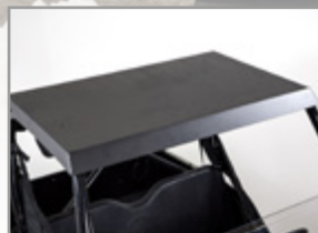
TOIT ALU SSV UXV 450i : KA-01-0602 UXV 700i Sport : KA-01-0371