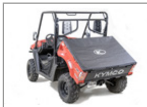
COUVRE BENNE SOUPLE UXV 450i : KA-01-0411 UXV 700i & Sport : KA-01-0410