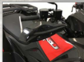
PROTÈGE-MAINS NOIR Droit : KA-01-0097 Gauche : KA-01-0096