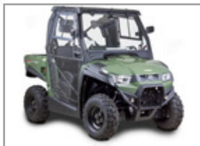
CABINE RIGIDE CHAUFFAGE / ESSUIE GLACE UXV 450i : KA-01-0620 UXV 700i : KA-01-0373 UXV 700i Sport : KA-01-0631