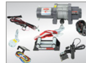
TREUIL KYMCO COME UP ATV 3000 AVEC TELECOMMANDE EXT 3 M QUAD / SSV KA-01-0026