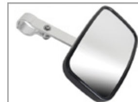
RETROVISEUR INTERIEUR GRAND ANGLE UXV 450i/700i : KA-01-0025