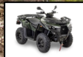
VERT / NOIR