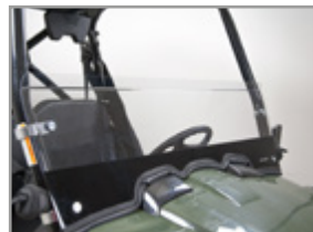
PARE-BRISE (AVEC SET DE FIXATION) GRAND : UXV 450i : KA-01-0600 UXV 700i : KA-01-0359 UXV 700i Sport : KA-01-0360 DEMI : UXV 450i : KA-01-0601 UXV 700i : KA-01-0028 UXV 700i Sport : KA-01-0427