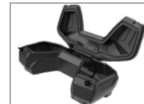
COFFRE ARRIERE GKA TOURING 1200 X 580 X 360 MM (115 L) KA-01-0656