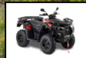
NOIR / ROUGE