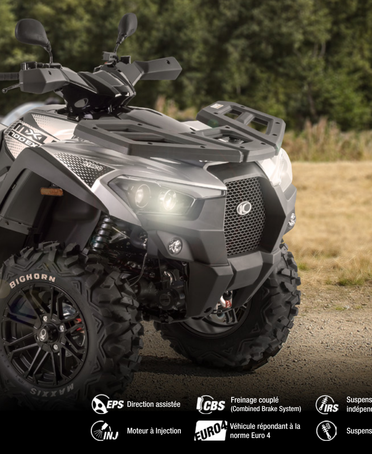
TABLE DE GAMME