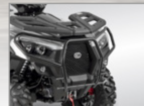
BUMPER AVANT MXU 550/700 ≥ 2019 ORANGE : KA-01-0627 NOIR MAT : KA-01-0628 MXU 550/700 < 2019 NOIR : KA-01-0637