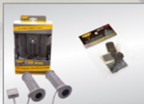
POIGNÉES CHAUFFANTES 120MM KA-01-0445 POUCE CHAUFFANT KA-01-0446

RENSEIGNEZ-VOUS AUPRÈS DE VOTRE CONCESSIONNAIRE. DE NOMBREUX ACCESSOIRES ADAPTÉS À VOTRE VÉHICULE SONT DISPONIBLES.