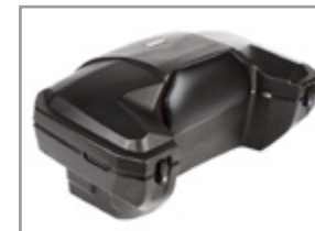
COFFRE ARRIERE GKA UNIVERSEL 970 X 550 X 445 MM (80 L) KA-01-0655