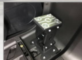
REPOSE-PIEDS PASSAGER RÉGLABLES (LA PAIRE) MXU 550/700 : KA-01-0653