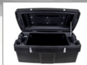
COFFRE UTILITAIRE QUADS/SSV QUEBEC CANADA 900 x 500 x 370 mm 150l KA-01-0453