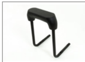
ACCOUDOIR UXV 450i/700i : KA-01-0024