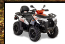
BLANC / ORANGE