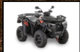
NOIR / ROUGE