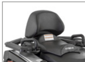
KIT CONFORT PASSAGER MXU 550/700 ≥ 2019 : KA-01-0639 MXU 550/700 < 2019 : KA-01-0014