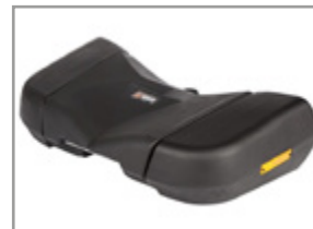
COFFRE AVANT GKA 870 X 480 X 210 MM (51 L) KA-01-0657