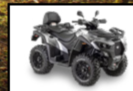
GRIS / NOIR