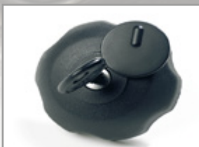
BOUCHON DE RÉSERVOIR À CLÉ POUR QUAD KA-01-0211