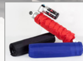
CHAUSSETTE D'AMORTISSEUR QUAD / SSV (L'UNITÉ) NOIR : KA-01-0394 ROUGE : KA-01-0395 BLEU : KA-01-0396