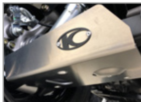
PROTECTION DE TRIANGLE ARRIERE (GAUCHE ET DROITE) MXU 550/700 < 2019 : KA-01-0362 MXU 700 ≥ 2019 : KA-01-0633